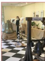
Exposition de cloches

Le parcours arboricole guidé dans le parc de l'abbaye lors des Journées Européennes du Patrimoine. Les auditions musicales à l'église ou les expositions successives (crèches, cloches, peintures...) qui attirent les visiteurs.