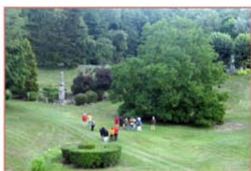
Journées du Patrimoine

✿ Les événements culturels et artistiques en cours d'année :