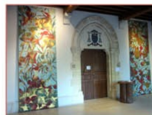
Œuvres de Pascal HONORÉ