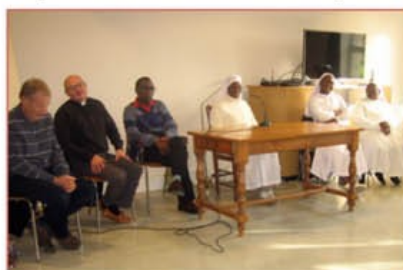
Équipe pastorale de l'Espace missionnaire

✿ Les visites monastiques dont celle du nouvel Abbé Général, venu rencontrer fin mai à Igny les abbés et abbesses d'OCSO France.